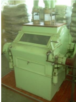
10) Double roller mill 3