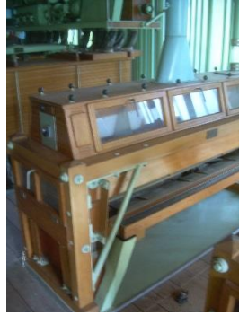
15) Semolina purifier2