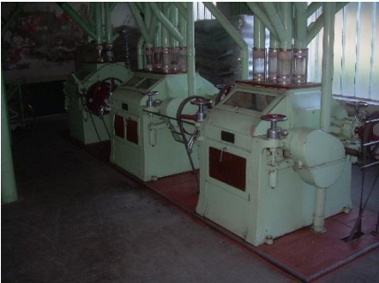
11) Piping 1