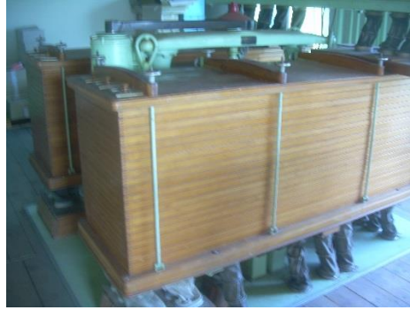
16) Plan sifter