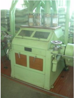
9) Double roller mill 2