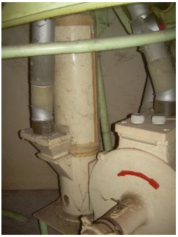
2) Bran brusher 1