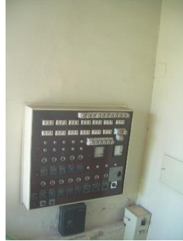
21) Control system