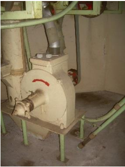
1) Grinding stone 1