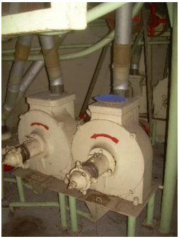
3) Grinding stone 2,3