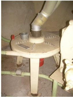
4) Impact mill