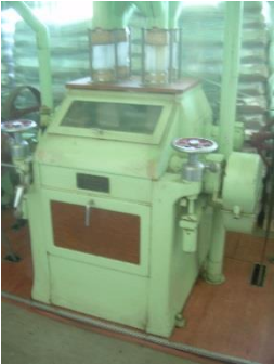
8) Double roller mill 1