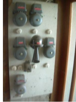
22) Alarm system