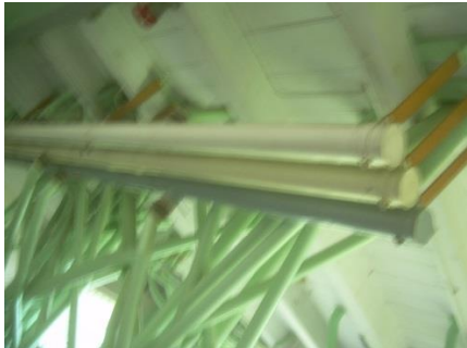
12) Convoyer pipes