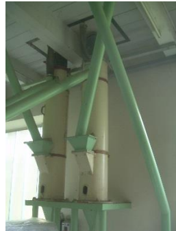
7) Bran brusher 2,3