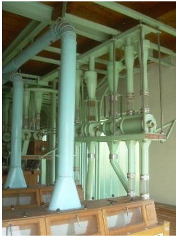
17) Cellular sluice 1