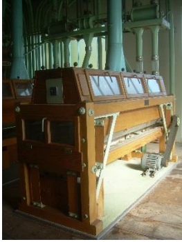
14) Semolina purifier 1