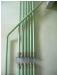
13) Piping 2