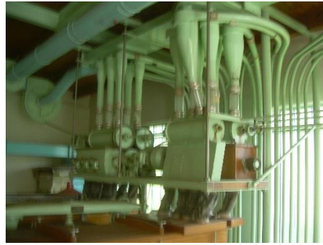
18) Cellular sluice 2